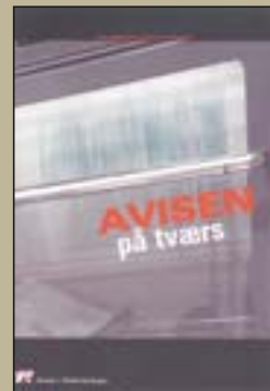
Avisen på tværs Pris: 60 kr. Klassesæt á min. 20 stk.: 900 kr.