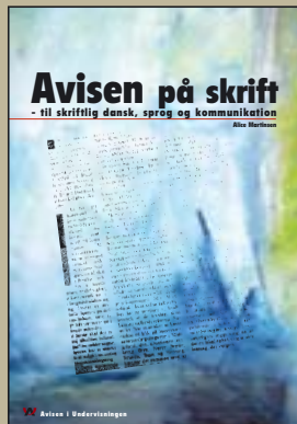
Avisen på skrift Pris: 50 kr. Klassesæt á min. 20 stk.: 750 kr.