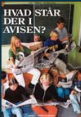
Hvad står der i avisen? 6.-10. klasse Pris: 48 kr. Klassesæt á min. 20 stk.: 720 kr.