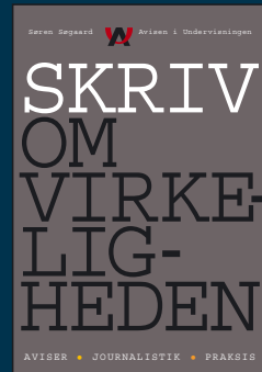
Skriv om virkeligheden Pris: 45 kr. Klassesæt á min. 20 stk.: 675 kr.

Bøger til undervisning og aviser med rabat til klassen og til skolebiblioteket, læs mere på www.aiu.dk