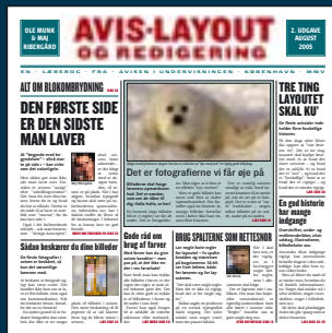
Avis-layout og redigering 6.-10. klasse Pris: 120 kr. Klassesæt á min. 20 stk.: 1.800 kr.