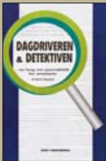
Dagdriveren og detektiven Pris: 90 kr. Klassesæt á min. 20 stk.: 1.350 kr.