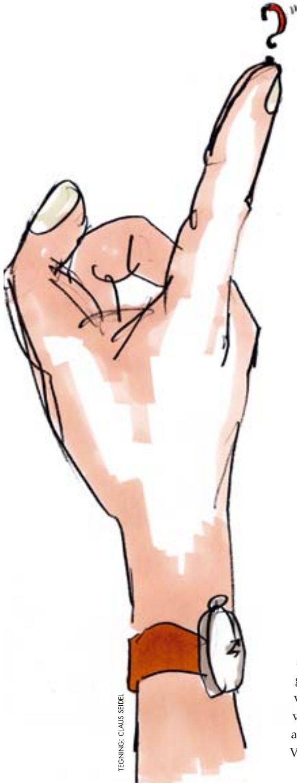
TEGNING: CLAUD SEIDEL

bestemt politisk menighed, måtte news skilles fra views, og nyheder samt andet journalistisk stof skulle have en mere central rolle. Opinionsstoffet skulle koncentreres i særlige holdningsprægede genrer som ledere, kronik, debatindlæg og læserbreve.