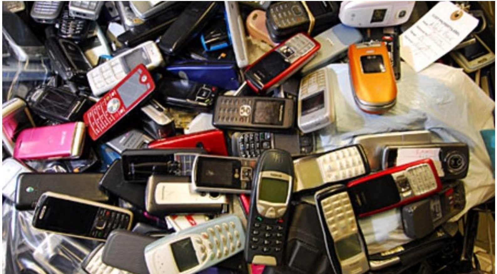
Hittegodskontor i London

Bliver der gjort noget ved problemet så folk ikke glemmer deres ting? "Altså ja på en måde der skilte i busserne og i togene hvor der står husk alle dine ejendele".