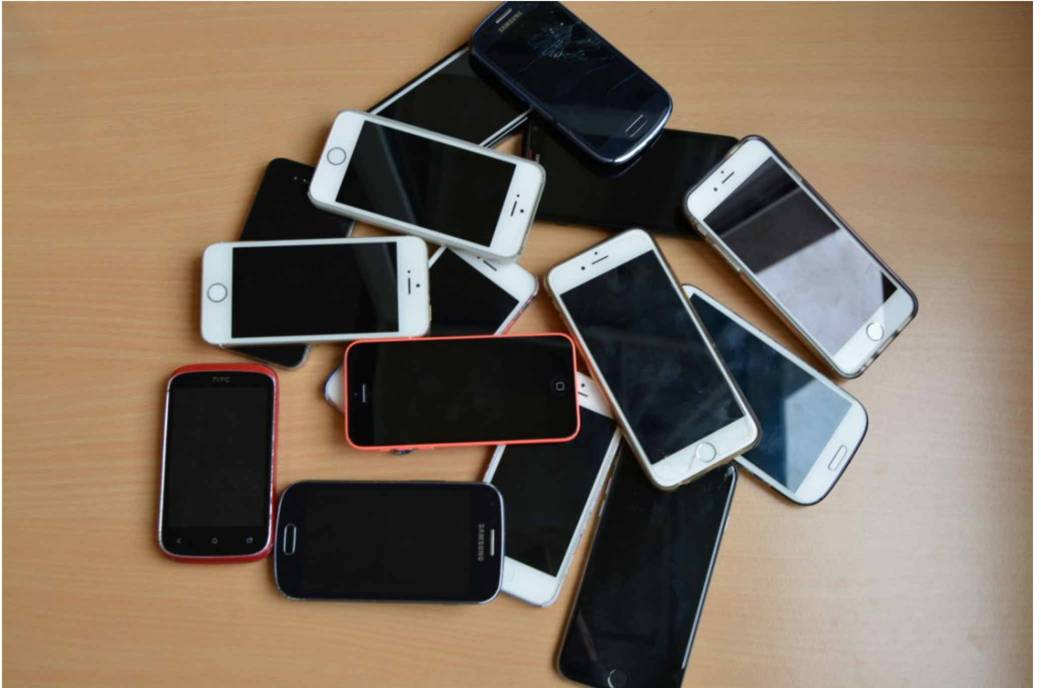
Østre skole, 7.B