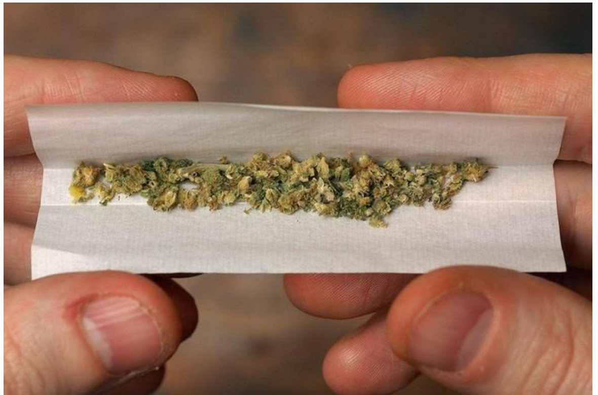
De unges indlæring harmonerer ikke med brug af hash