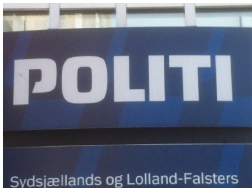
Politiet arbejder på højtryk for at få beviserne klar

Sygeplejersken er tiltalt for at have dræbt 3 samt mordforsøg på en fjerde. Den sigtede må kun have fysisk kontakt med sin familie eller via breve som bliver tjekket af politiet. Hendes familie må ikke snakke med hende omkring sagen, da det kunne påvirke bevismaterialet. Hvis hun på mystisk vis findes i besiddelse af en telefon, kan hun blive straffet endnu hårdere. Denne sag er meget ressourcekrævende, siden der er afhørt over 90